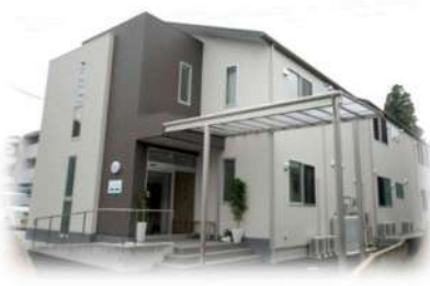
■グループホーム福井町