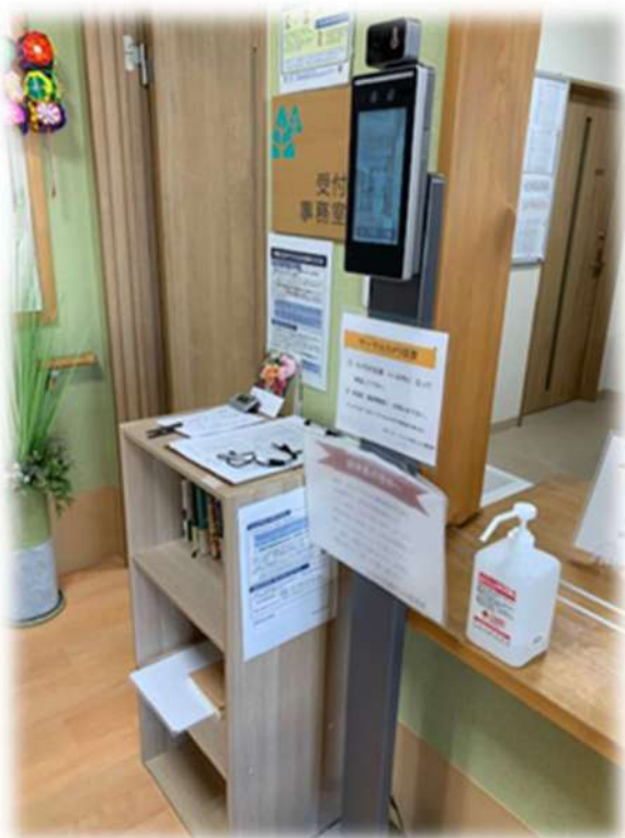
■非接触型体温券（玄関前）