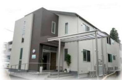
■グループホーム福井町