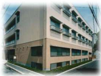
■グループホーム旭町